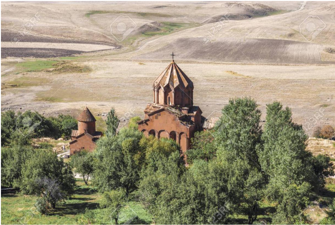
亚美尼亚的马尔马神修道院，位于希拉克州