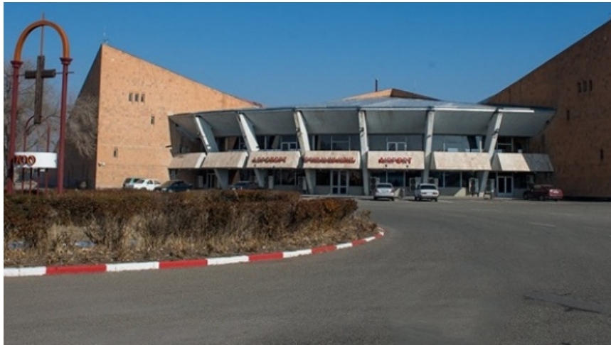
希拉克州国口机口